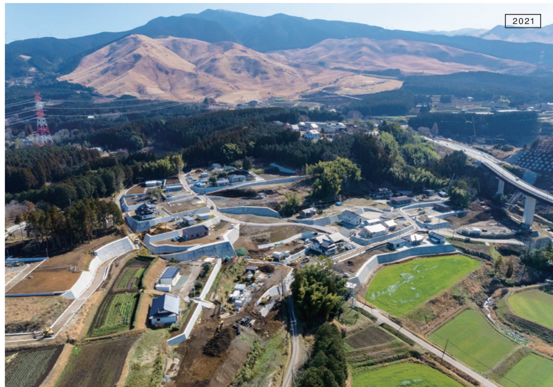
Sanriku Coast Expressway (Kamaishi - Yamada) | Amane TOMATSU 三陸沿岸道路釜石山田道路 | 技術者：戸松周 Plan Design Management Operation